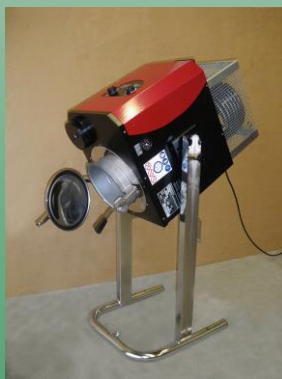
Anlage geschwenkt zur Restentleerung