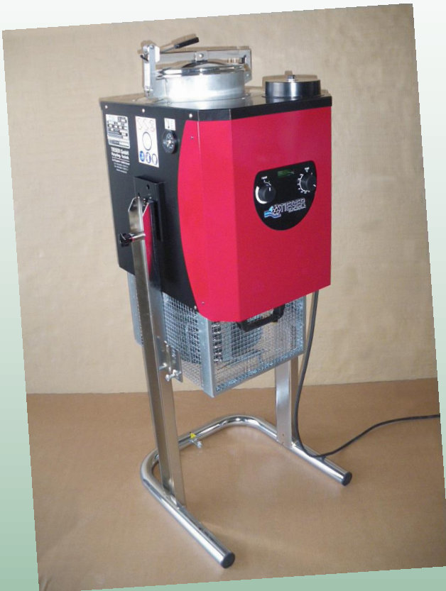
D12 A / AX