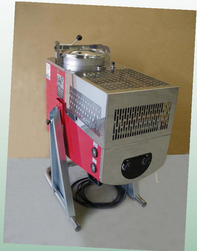
D25 A / AX