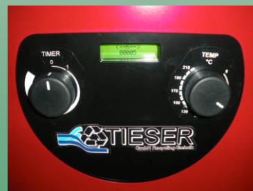
LCD Anzeige mit Mikroprozessor